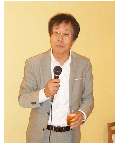
乾杯の音頭：野田会員