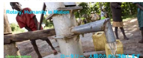
ロータリー、人類のために活動します