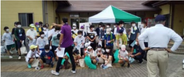
2022.08.24: 高校生 VS ジュニア VS スポーツごみ拾い