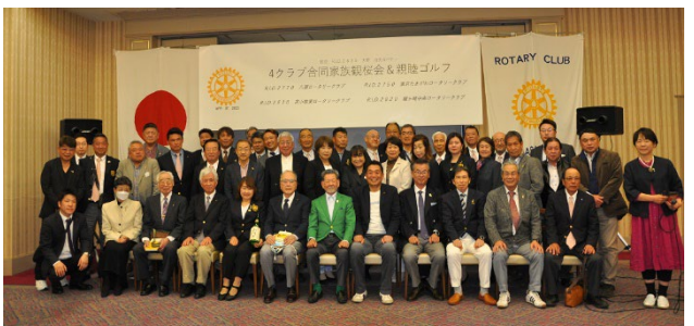
2023.04.07:観桜会: 苫小牧東・東京玉川・八潮 RC