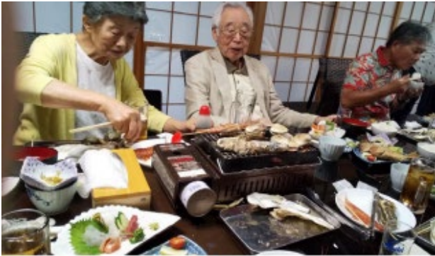
2022.08.19:家族納涼会 潮来カントリー 漁師小屋